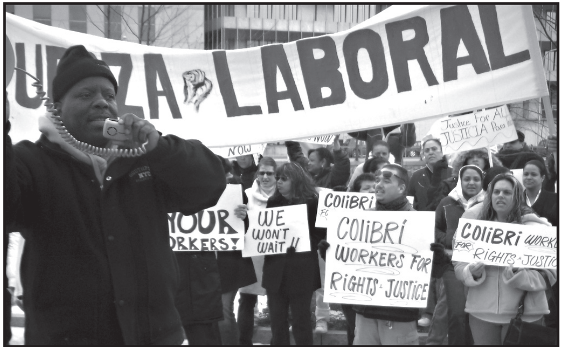
Colibri Workers for Rights and Justice

No es este fracaso el resultado de la avaricia de unos cuantos pocos? ¡Claro que no! Es el sistema economico, el ciclo de subida y